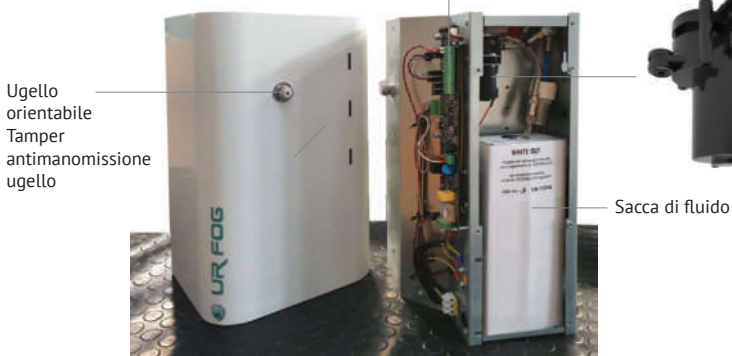
Scheda Pro Plus