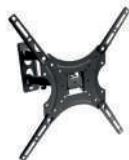
Staffa a muro orientabile