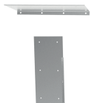
Riser superiore e laterale