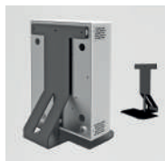
Supporto da tavolo